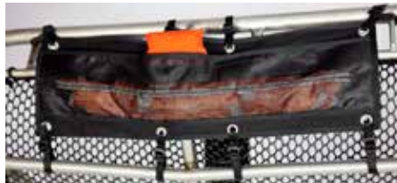
Figura 4 - Cinturino laterale applicato correttamente

6. Fissare i due cinturi laterali superiori intorno al tubo superiore della barella assicurandosi che non passino attraverso i punti di aggancio della barella per i moschettoni (Figura 4).