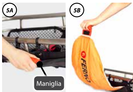
Figura 5 - Estrarre la vela