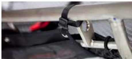
Figura 3 - Cinturini applicati saldamente al tubo superiore e inferiore della barella

5. Ripetere le stesse operazioni con i restanti 3 cinturi da fissare al tubo superiore (Figura 3) e i 4 cinturini da fissare al tubo inferiore della barella (Figura 3).