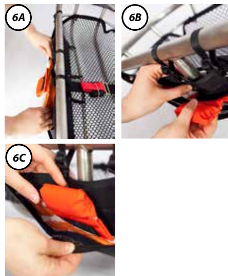
Figura 6 - Riporre la vela

Quando la vela EARS non viene utilizzata, riporla nell'apposita custodia.