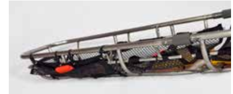
Figura 1 - Vela antirotazione EARS montata lato piedi barella

Per l'applicazione corretta della vela, procedere come segue.